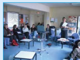
Atelier Education Thérapeutique